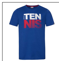
CAMISETA NO REGLAMENTARIA