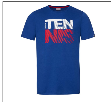
CAMISETA NO REGLAMENTARIA